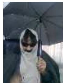
شاهین نجفی (خواننده ی رپ)